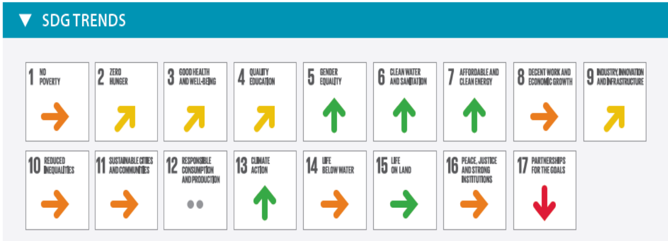
Fig 3-Trend dell'Italia nei 17 Goal, dal Rapporto Bertelsmann 2018

Un esame più dettagliato mostrerebbe sia situazioni negative persistenti, sia azioni positive avviate. Tra queste ultime si potrebbe segnalare l'inserimento per legge nel DEF (e relative implicazioni) di 12 indicatori fondamentali del "benessere", oppure la grande azione di sensibilizzazione svolta da ASVIS attraverso 200 Associazioni di ogni tipo, e culminata in un FESTIVAL di 17 giorni, con oltre 700 manifestazioni riguardanti tutti i 17 Goal. Potrà essere molto importante, se non sarà modificata, anche la Direttiva del 16.3.2018 che dà vita all'organismo di coordinamento delle politiche economiche, sociali e ambientali per il raggiungimento dei 17 Obiettivi di sviluppo sostenibile.